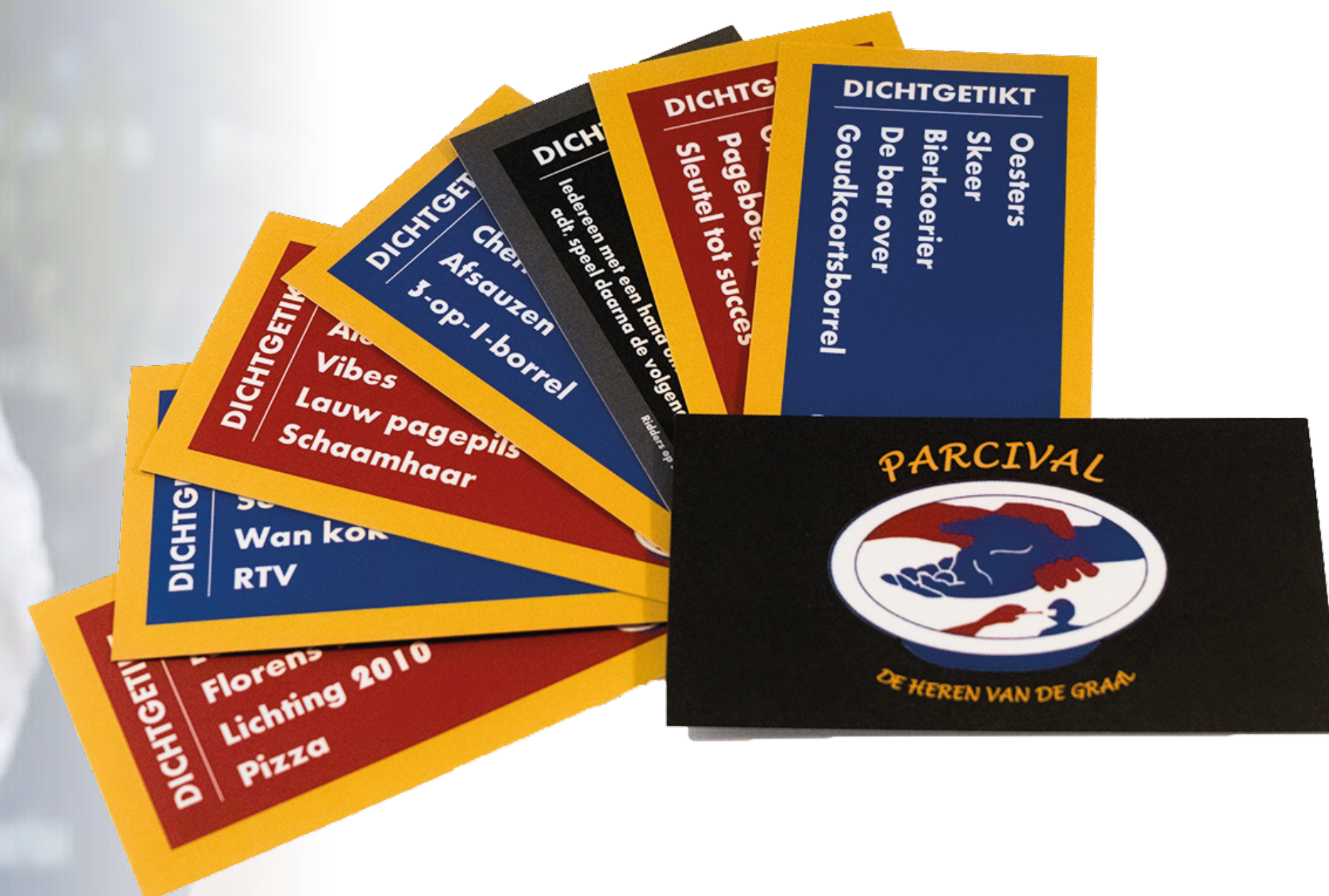
voorbeeld van branded product